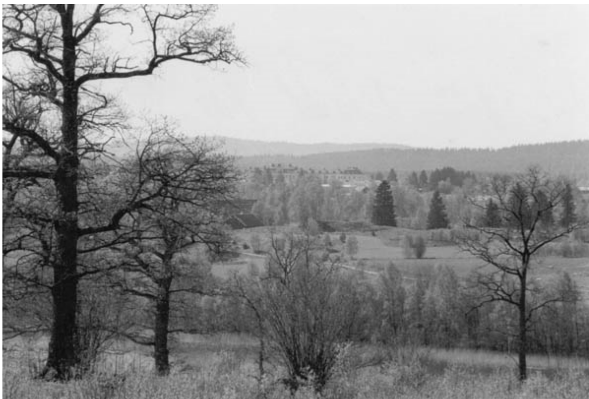
Utsikt från Qvensås