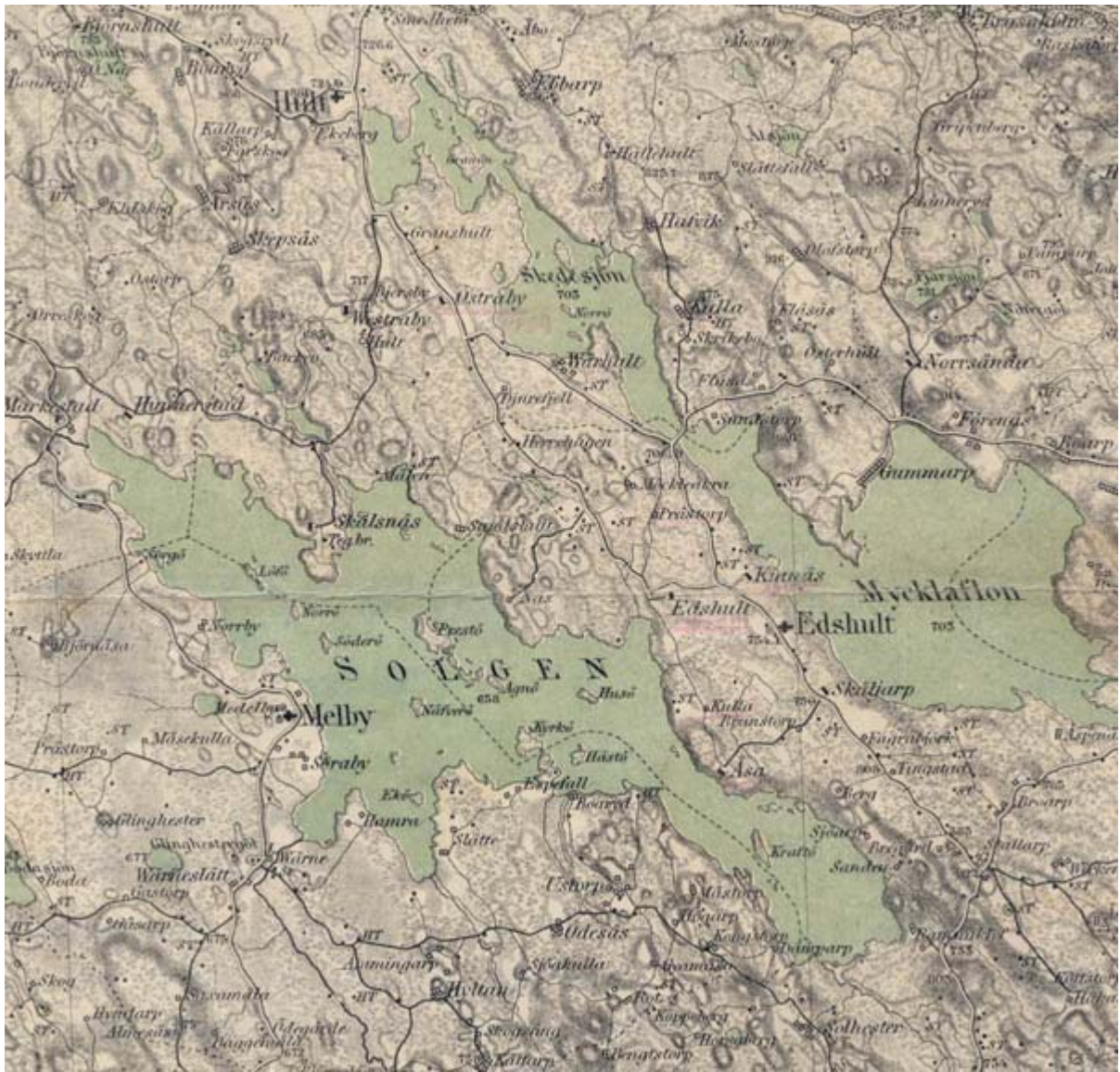
Trakten kring Edshult